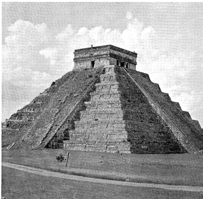
El Castillon Pyramidi, (Jaguarin Valtaistuin)